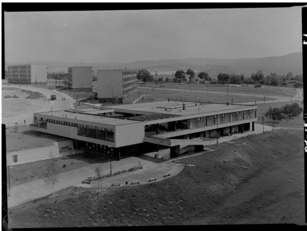
Dnes již neexistující okrskové centrum Lučina, 1967.

určitého počtu bytů jeden areál občanského vybavení (tzv. okrskové centrum) s obchody, základními službami, restaurací a menším společenským sálem. Tyto nízké budovy s atrií měly mimo jiné i důležitou sociální funkci – sloužily jako přirozené společenské centrum daného okrsku. Z architektonického hlediska nešlo v žádném případě pouze o utilitární stavby pro zajištění služeb obyvatelům. Dva areály byly realizovány na základě projektu Miroslava Dufka (Lučina a Dukát), přičemž klasický (ovšem bohužel dnes již neexistující) pohled na Lučinu je znám v anglosaském světě od konce 60. let z obálky jedné z publikací o moderní architektuře. Druhé dva podobné areály (Polana a Obzor) projektoval Viktor Rudiš. V souvislosti s areálem Obzor se nezdálo mluví o návaznostech na brněnský funkcionalismus. 14