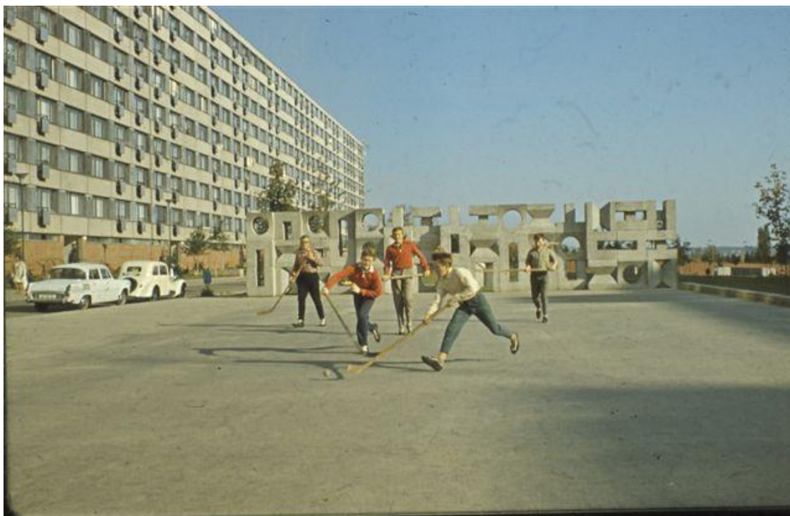
Dekoratивní zed' Čestmíra Kafky, ulice Arbesova, 1968.

Dokončované sídliště Lesná budilo pozornost a zájem neobyčejným pojetím ztvárnění prostoru, způsobem realizace, stavebními postupy, smělou a vpravdě revoluční myšlenkou spojení na první pohled neslučitelného. O Lesné se diskutovalo a psalo nejen mezi architekty a urbanisty, ale i stavbaři.