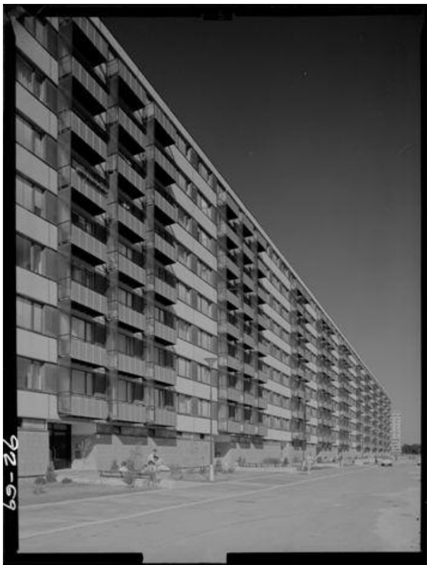
Deskový panelový dům, ulice Jurkovičova, 1968.

s obrazem obytných domů stejně jako s prostorovým vnímáním.“ 12 „Zmizely souvislé betonové stěny - obvyklé produkce paneláků. Substrukce obytných podlaží jsou výrazně funkčně a materiálově odlišeny. První použití barevné keramiky v tomto rozsahu a vstupní haly v úrovni terénu jsou přímo symbolickou vzpourou proti vládnoucí nivelizující ekonomice. Celkový obraz Lesné je spjat s těmito charakteristickými znaky, do kterých jsme vložili svá srdce a mnoho úsilí.“ 13