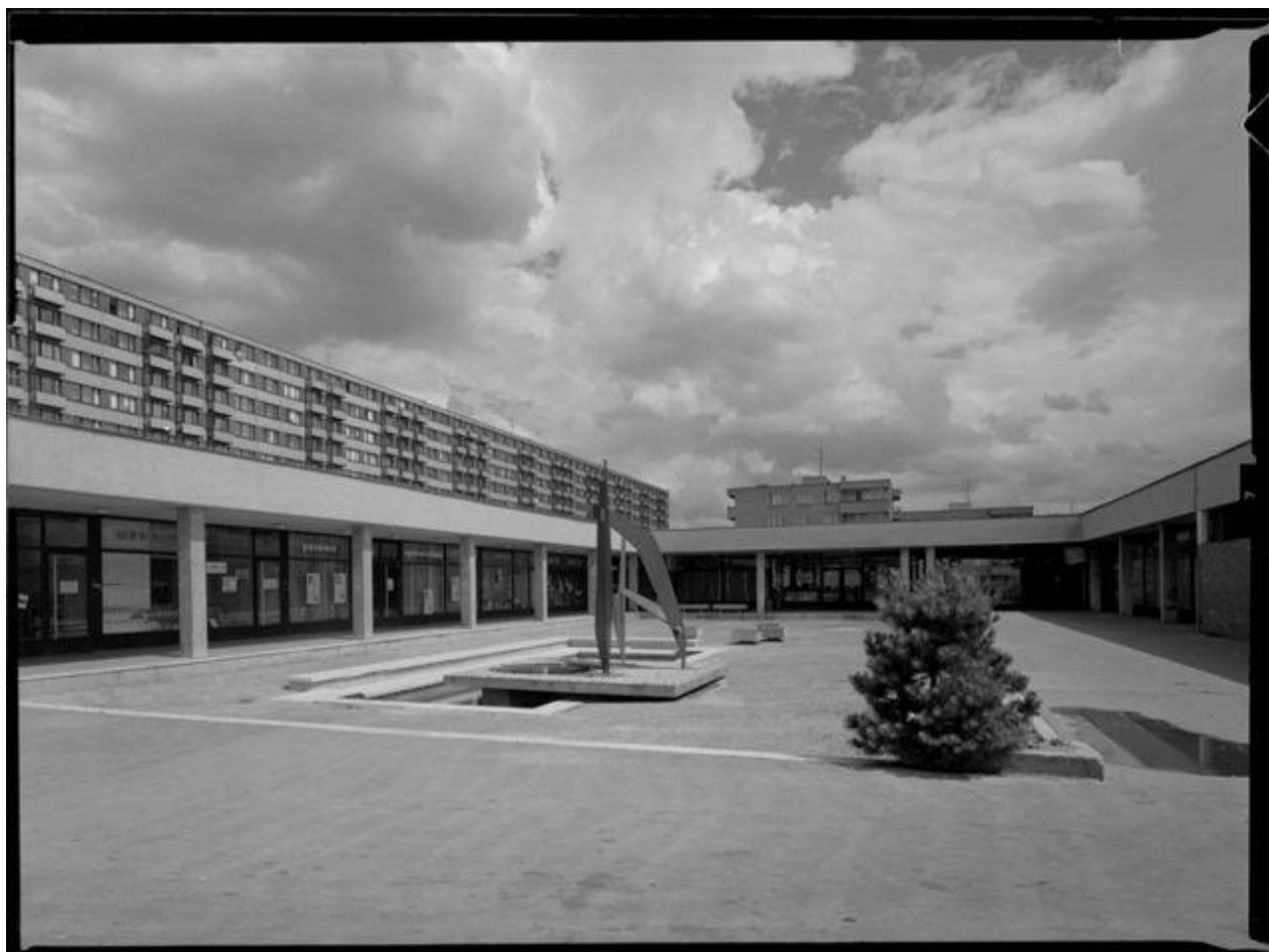
Dodnes v původní podobě zachovalý areál Obzor, 1974.

Když byl v roce 1958 vládou ČSSR formulován požadavek energického řešení bytového problému, město Brno reagovalo na urgentní potřebu nových bytů záměrem vystavět nový obytný celek pro 20 000 obyvatel. Jako nejvhodnější lokalita pro soustředěnou výstavbu takového rozsahu (která neměla do té doby v Brně obdoby) bylo vybráno území severně za železniční trať Tišnovka. Tento k jihu obrácený, celodenním osluněním disponující svah táhnoucí se až k začátku soběšického lesa sloužil již od nepaměti jako cvičný vojenský prostor.