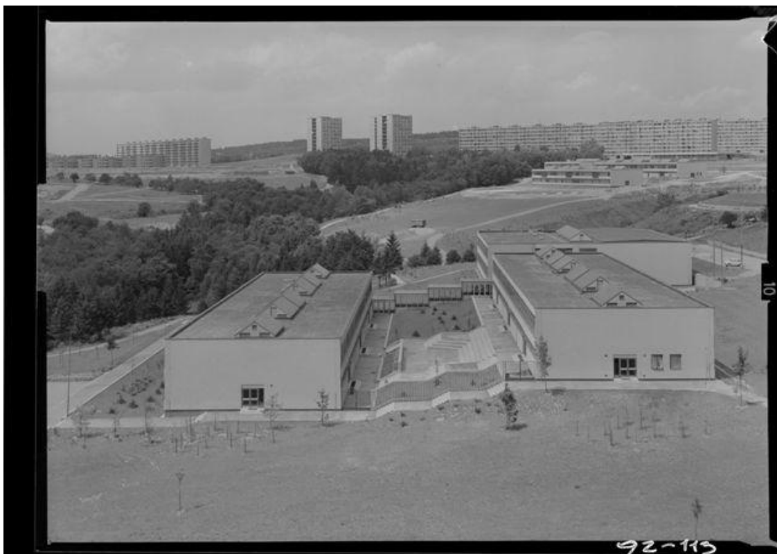
Pavilonové komplexy základních škol na okraji Čertovy rokle (Nejedlého a vzadu Blažkova), 1968.

Ještě v průběhu projekčních prací se podařilo Františku Zounkovi prosadit „ doplňující urbanistický element “ - dvě skupiny cihlových 4 podlažních bodových domů (ulice Jurkovičova a Brožíkova) a šestici vějířovitě seskupených, řadových cihlových 4 podlažních domů (ulice Nejedlého). U velkých deskových domů dokázal Zounek vytvořit - i přes svázanost typovostí panelové technologie – svébytnou architektonickou hodnotu. S ohledem na stejný standard úrovně bydlení v těchto domech odmítal umístit byty do přízemí, které zůstalo vyhrazeno pouze pro hospodářské a společné prostory. Vstupy do jednotlivých vchodů svým prostorovým členěním a obložením opaxitovými kachlemi odkazovaly na vstupní haly objektů prvorepublikové funkcionalistické architektury. Celé přízemí bylo zvenčí obloženo keramickým obkladem a součástí fasády bylo také použití mramorové drti. Tyto velké deskové panelové domy, označované 8 + 1 (osm bytových pater plus nebytové přízemí) tvoří hlavní objem obytné zástavby na Lesné. Na délku obsahují osm až dvanáct vchodů a jejich původní vzhled charakterizují nejlépe slova samotných tvůrců: „ Jejich architektonickým znakem jsou výrazné horizontály parapetních pásů s kvalitním povrchem bílé mramorové drti, horizontály okenních pásů v tmavých barvách a keramický obklad celého vstupního podlaží rytmizované vertikálami balkonů na jižní straně a schodišťovými travé na straně severní. Toto barevné a architektonické členění je neodmyslitelně svázáno